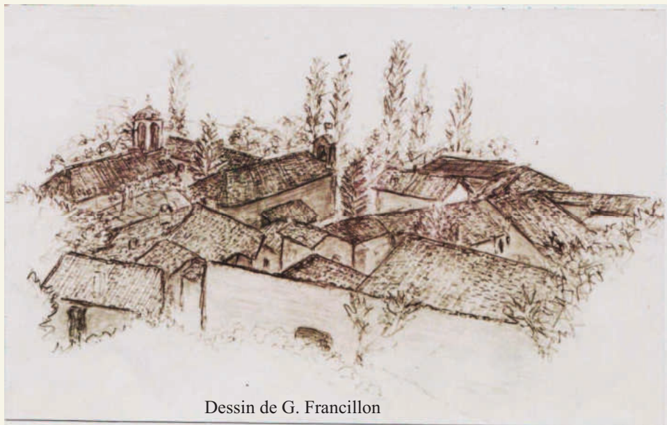
Dessin de G. Francillon

La vallée de Quint est prête pour l'aventure d'un club du 3ième Age! »