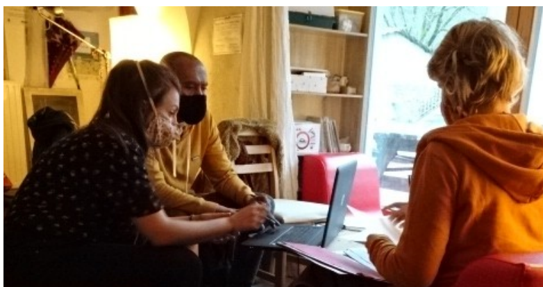
Illustration 1: Séance de médiation numérique à l'Épilibre