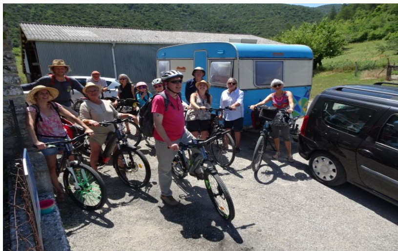
Illustration 3: Sortie vélos avec des bénévoles de la commission transition énergie et mobilité de Valdequint

L'année 2022 a eu comme principal objectif de construire collectivement le projet « Mobilité durable et solidaire en vallée de Quint » qui fait l'objet d'une subvention européenne LEADER, afin de développer les services de mobilité alternatives et de mener des actions de sensibilisation sur la période 2022-2024. Les autres objectifs des réunions de commission ont été de dresser le bilan sur les actions menées de 2020 à 2022 ; de concevoir des animations dans le cadre du renouvellement du projet social de Valdequint, et d'élaborer un plan d'action 2023-2026 à partir des résultats du diagnostic de territoire.