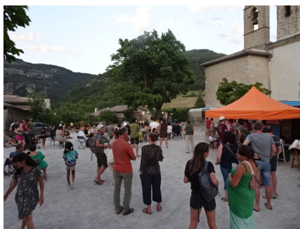
Illustration 2: Animations brocante du 1 er mai à St-Julien (à gauche), Concert des « Smokin Jive » à Ste-Croix (à droite)

La commission « Culture et convivialité » a également pour vocation d'aller à la rencontre des habitants de la vallée par l'itinérance dans les différentes communes. C'est pourquoi nous avons fait le choix de diversifier les lieux d'accueil des artistes, se rendant de village en village, avec la caravane culturelle.