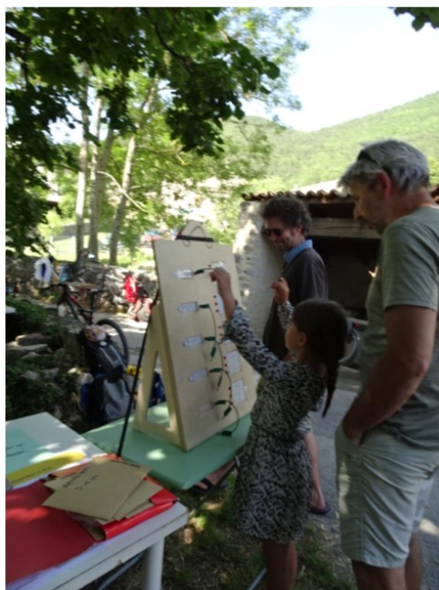
Illustration 5: Atelier réparation vélos et quizz de la mobilité dans le cadre de la « Journée festive mobilité » organisée par Valdequint