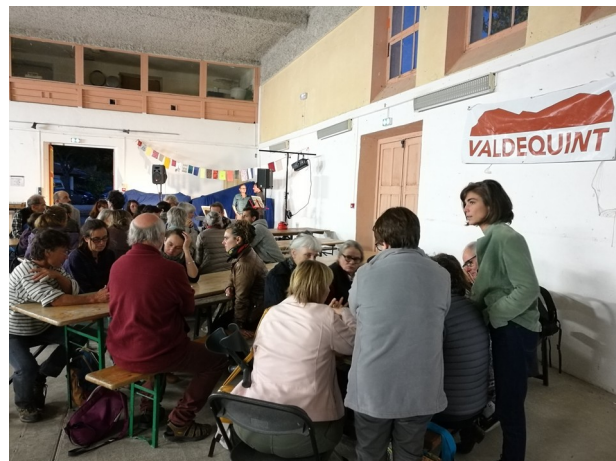
Illustration 6: Restitution du diagnostic et ateliers de discussion avec les habitants le 15 octobre à Sainte Croix

Nous avons eu 148 répondants au questionnaire ! Les résultats de ce diagnostic sont disponibles sur notre site internet https://valdequint.fr/ .